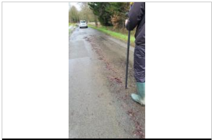
relevé de la laisse d'inondation sur la chaussée le 29/01/2025

GÉNÉRAL Code : SPC_35363-003_2025 Date de mise à jour : 16/10/2025 Auteur : SPC VCB