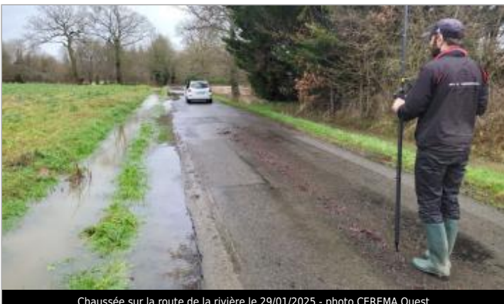
Chaussée sur la route de la rivière le 29/01/2025

GÉOLOCALISATION Coordonnées WGS84 : X: -1.68078479 / Y: 48.02703590 Coordonnées RGF93 (Lambert 93) X: 351291.39 / Y: 6779966.51 Coordonnées RGF93 (ETRS89) : X: -1.6807848 / Y: 48.0270359 Code Hydro: J74-0300 Rive de référence: Gauche