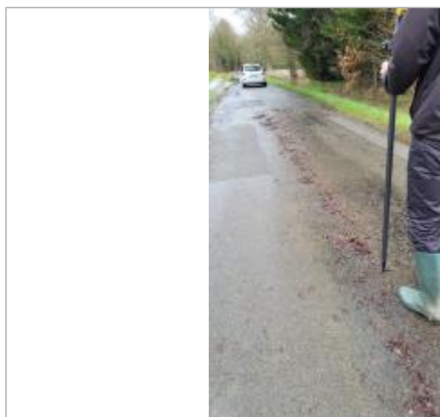
relevé de la laisse d'inondation sur la chaussée le 29/01/2025