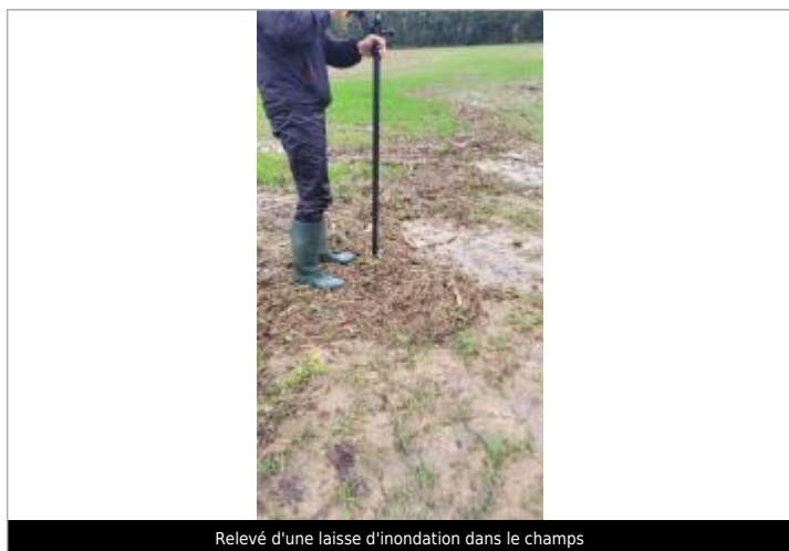
Relevé d'une laisse d'inondation dans le champs