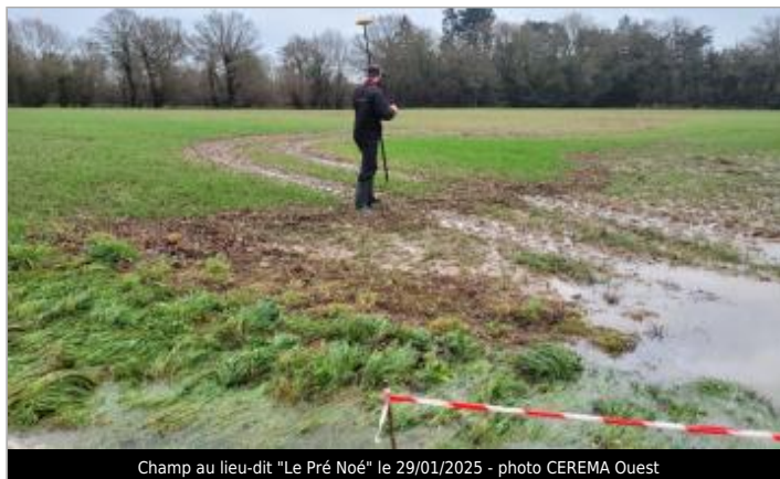
Champ au lieu-dit "Le Pré Noé" le 29/01/2025