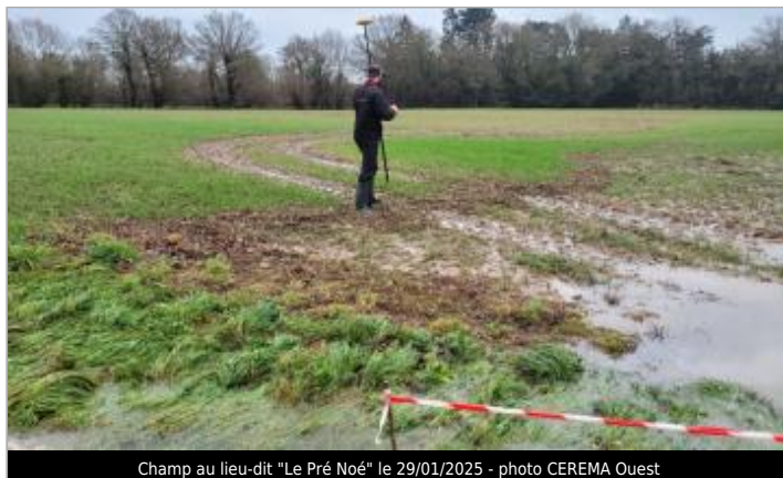
Champ au lieu-dit "Le Pré Noé" le 29/01/2025

Coordonnées WGS84 : X: -1.68061947 / Y: 48.02824150