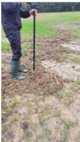
Relevé d'une laisse d'inondation dans le champs