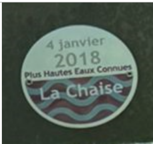
repère de crue