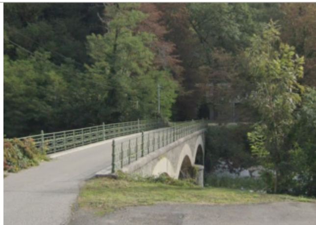
Pont des Bossons