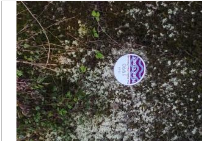
Hauteur principalement liée à l'engravement de la plage de dépôt