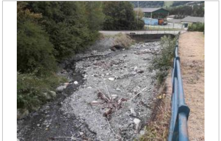
Plage de dépôt à l'aval du pont Ostoréro