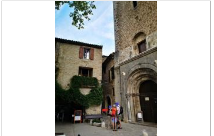
Vue du site, sept. 2025