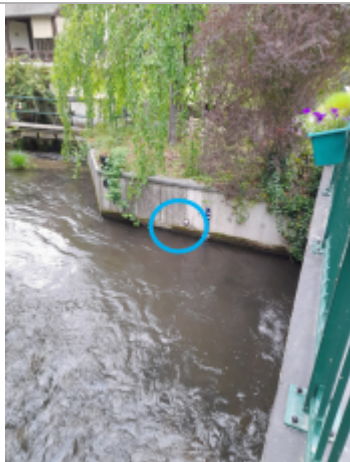
Photo prise par le gagnant du concours "Mission repères de crue" organisé par le SIARCE en 2025

Altitude calculée de l'eau (en m) : 64.55 m