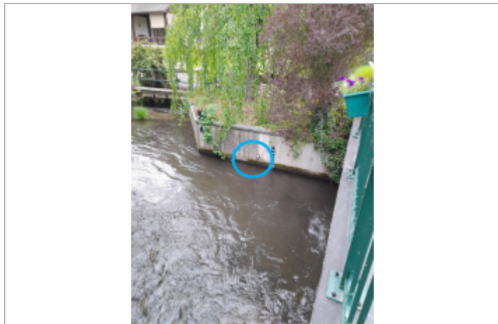
Photo prise par le gagnant du concours "Mission repères de crue" organisé par le SIARCE en 2025

Texte : "Plus hautes eaux connues, Essonne, 4 juin 2016" Maximum de l'inondation : Oui Visibilité : Oui