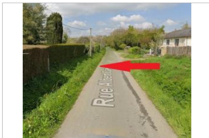
Bord du boulevard des Citeaux

GÉOLOCALISATION Coordonnées WGS84 : X: -1.66945852 / Y: 48.03469510 Coordonnées RGF93 (Lambert 93) X: 352184.49 / Y: 6780766.19 Coordonnées RGF93 (ETRS89) : X: -1.6694585 / Y: 48.0346951 Code Hydro: J74-0300 Rive de référence: Gauche