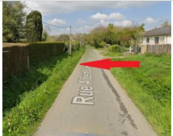
Bord du boulevard des Citeaux

Coordonnées WGS84 : X: -1.66945852 / Y: 48.03469510