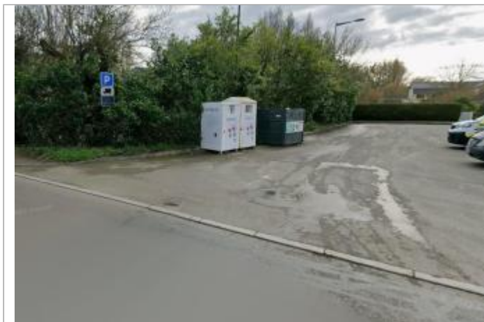
Parking place Joseph Cugnot