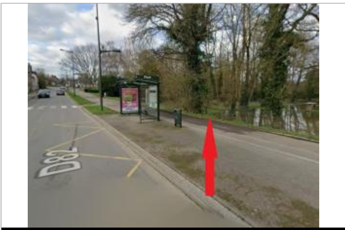
Bord de la RD82 au niveau de l'arrêt de bus

GÉOLOCALISATION Coordonnées WGS84 : X: -1.66648512 / Y: 48.03848730 Coordonnées RGF93 (Lambert 93) X: 352430.61 / Y: 6781173.77 Coordonnées RGF93 (ETRS89) : X: -1.6664851 / Y: 48.0384873 Code Hydro: J74-0300 Rive de référence: Droite