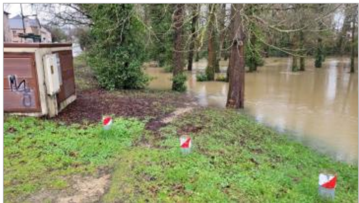
parc lors de l'inondation le 29/01/2025

GÉNÉRAL Code : SPC_35206_061_2025 Date de mise à jour : 10/10/2025 Auteur : SPC VCB