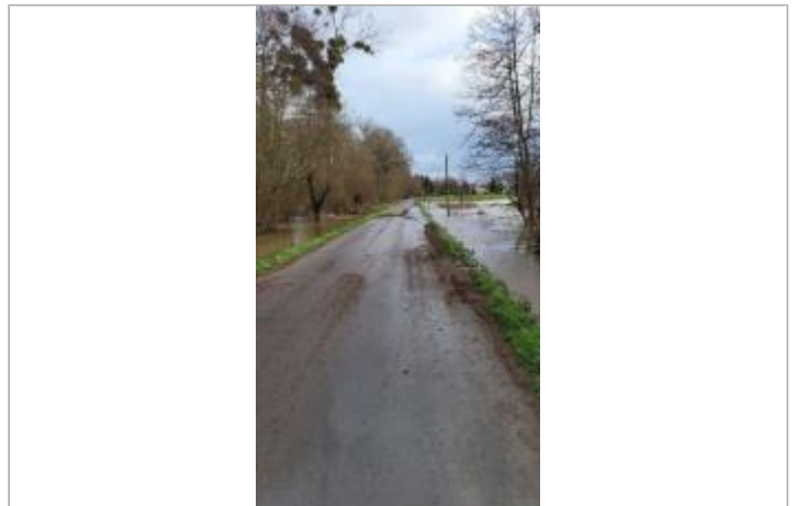
rue du moulin entre Noyal et Brécé le 29/01/2025