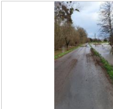
rue du moulin entre Noyal et Brécé le 29/01/2025

Coordonnées WGS84 : X: -1.65205431 / Y: 48.04138860