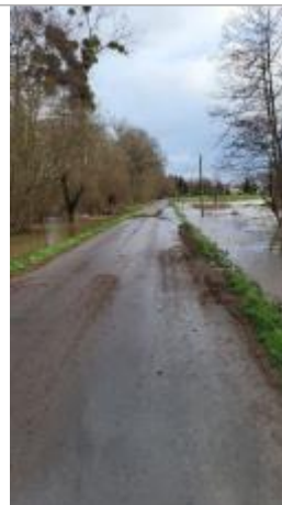
Rue du moulin le 29/01/2025