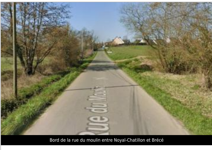
Bord de la rue du moulin entre Noyal-Chatillon et Brécé

GÉOLOCALISATION Coordonnées WGS84 : X: -1.65171919 / Y: 48.04135080 Coordonnées RGF93 (Lambert 93) X: 353547.86 / Y: 6781426.53 Coordonnées RGF93 (ETRS89) : X: -1.6517192 / Y: 48.0413508 Code Hydro: J74-0300 Rive de référence: Droite