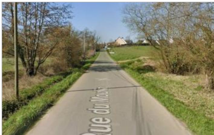
Bord de la rue du moulin entre Noyal-Chatillon et Brécé

Coordonnées WGS84 : X: -1.65171919 / Y: 48.04135080