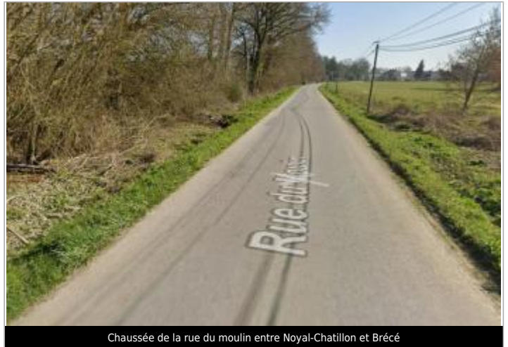
Chaussée de la rue du moulin entre Noyal-Chatillon et Brécé

Coordonnées WGS84 : X: -1.65085484 / Y: 48.04114170