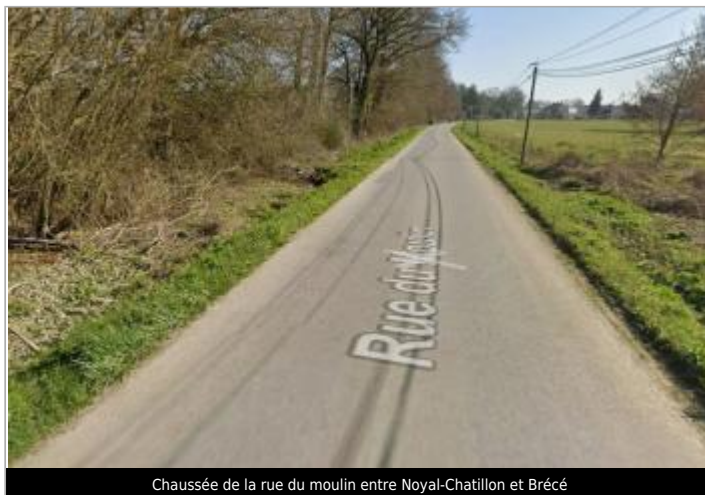
Chaussée de la rue du moulin entre Noyal-Chatillon et Brécé