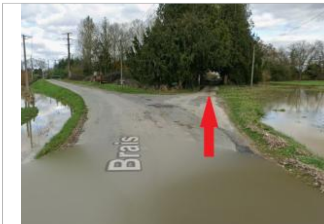
route de Brais vers l'Ise après le carrefour

Coordonnées WGS84 : X: -1.65476961 / Y: 48.02839130