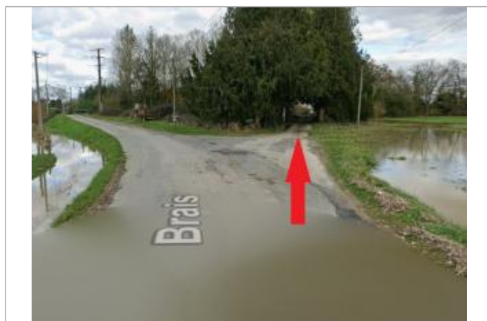
route de Brais vers l'Ise après le carrefour