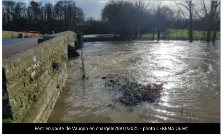
Pont en voute de Vaugon en charge le 28/01/2025

MARQUE Visibilité : Non Repère calculé : Non PHEC : Oui