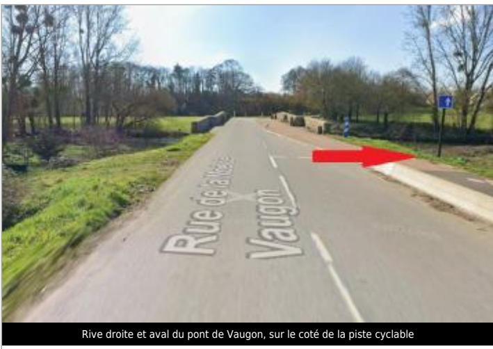
Rive droite et aval du pont de Vaugon, sur le coté de la piste cyclable

GÉOLOCALISATION Coordonnées WGS84 : X: -1.59911734 / Y: 48.02794990 Coordonnées RGF93 (Lambert 93) X: 357374.42 / Y: 6779710.39 Coordonnées RGF93 (ETRS89) : X: -1.5991173 / Y: 48.0279499 Code Hydro: J74-0300 Rive de référence: Droite