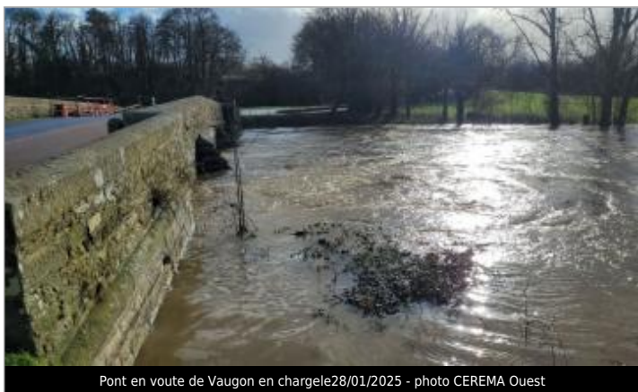
Pont en voute de Vaugon en charge le 28/01/2025

MARQUE Visibilité : Non Repère calculé : Non PHEC : Oui