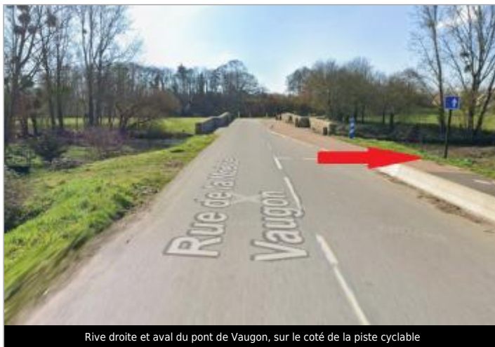
Rive droite et aval du pont de Vaugon, sur le coté de la piste cyclable

GÉOLOCALISATION Coordonnées WGS84 : X: -1.59911734 / Y: 48.02794990 Coordonnées RGF93 (Lambert 93) X: 357374.42 / Y: 6779710.39 Coordonnées RGF93 (ETRS89) : X: -1.5991173 / Y: 48.0279499 Code Hydro: J74-0300 Rive de référence: Droite