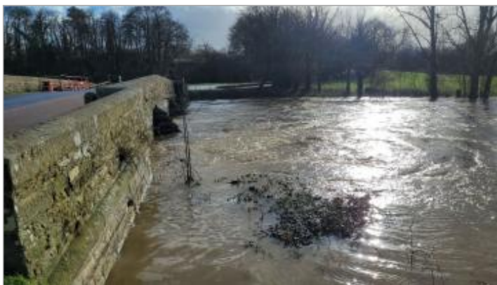
Pont en voute de Vaugon en charge le 28/01/2025

Altitude calculée de l'eau (en m) : 25.305