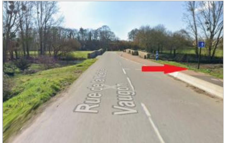
Rive droite et aval du pont de Vaugon, sur le coté de la piste cyclable

Coordonnées WGS84 : X: -1.59911734 / Y: 48.02794990