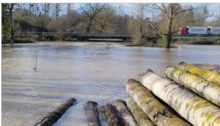
Vue du pont de la RD 173 du pont de Vaugon le 28/01/2025