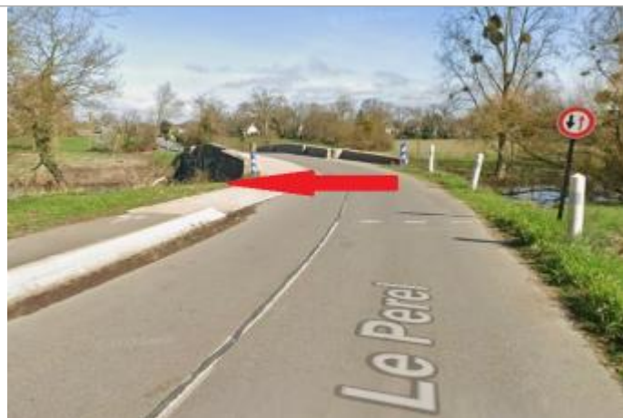
Rive gauche et aval du pont de Vaugon, sur le coté de la piste cyclable