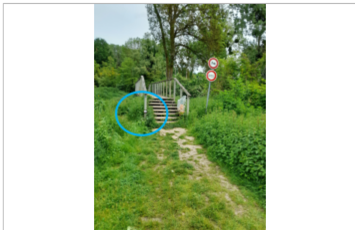
Photo prise par le gagnant du concours "Mission repères de crues" organisé par le SIARCE en 2025

Texte : "Plus hautes eaux connues, Essonne, 4 juin 2016" Maximum de l'inondation : Oui Visibilité : Oui