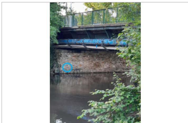
Photo prise par le gagnant du concours "Mission repères de crue" organisé par le SIARCE en 2025

Texte : "Plus hautes eaux connues, Essonne, 6 juin 2016" Maximum de l'inondation : Oui Visibilité : Oui