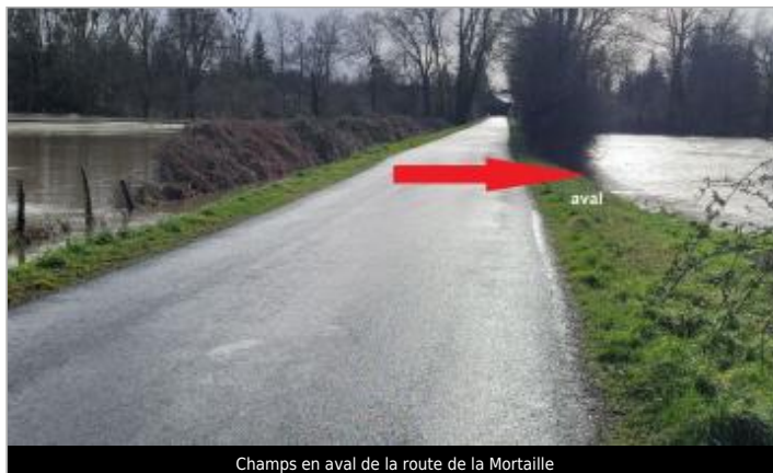
Champs en aval de la route de la Mortaille