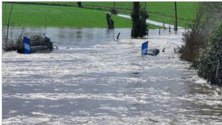
Ponceau de la route de la Ponçais le 28/01/2025