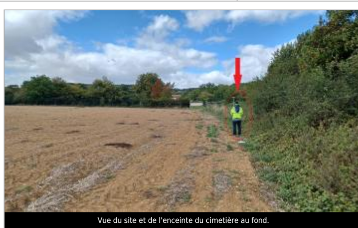
Vue du site et de l'enceinte du cimetière au fond.

GÉOLOCALISATION Coordonnées WGS84 : X: 1.34979277 / Y: 48.71765700 Coordonnées RGF93 (Lambert 93) X: 578604.1 / Y: 6847660.02 Coordonnées RGF93 (ETRS89) : X: 1.3497928 / Y: 48.717657 Code Hydro: H41-0410 Rive de référence: Gauche