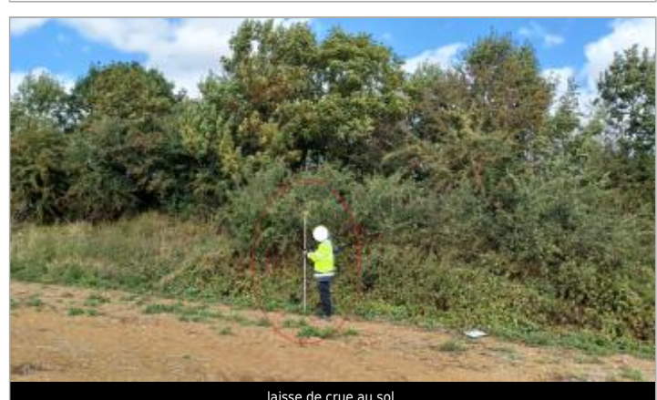
laisse de crue au sol.

GÉNÉRAL Code : WEB_R_202510081514 Date de mise à jour : 08/10/2025 Auteur : SPC.SACN