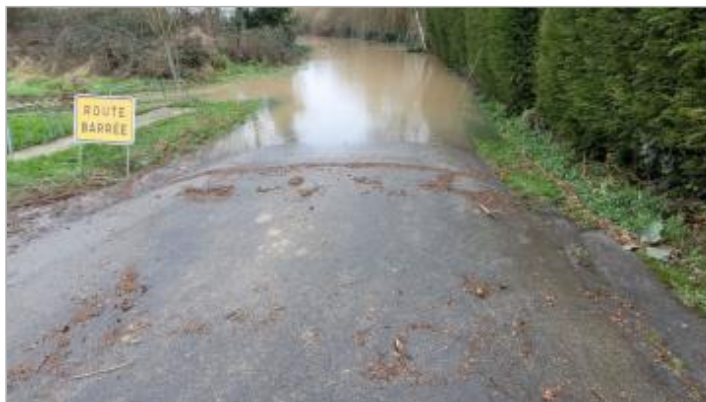
Début de la route du pont de la Seiche au départ de la RD92