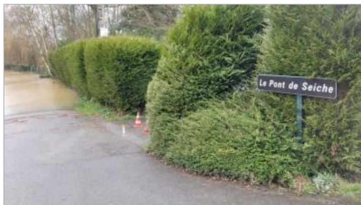
Laisse d'inondation au pont de la Seiche le 28/01/2025