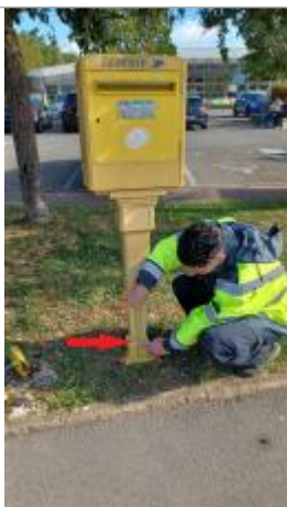
Laisse de crue à 9 cm/sol.

Altitude calculée de l'eau (en m) : 93.39