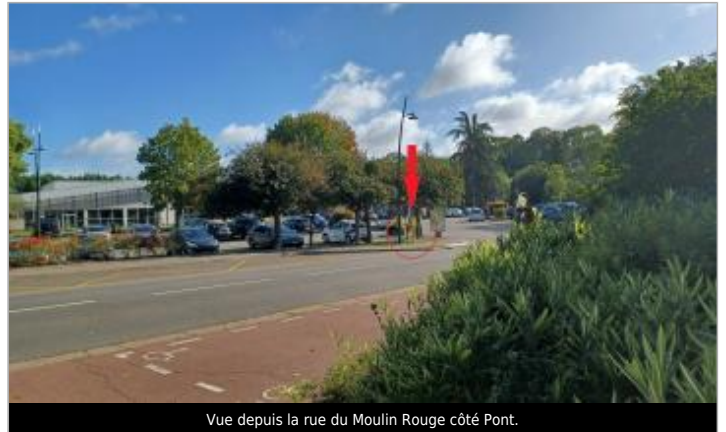
Vue depuis la rue du Moulin Rouge côté Pont.

Coordonnées WGS84 : X: 1.35569419 / Y: 48.72075360