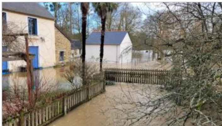
Maisons à l'entrée du village de "Laval" en rive gauche de la Seiche