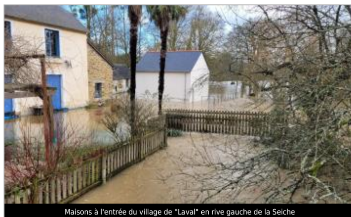
Maisons à l'entrée du village de "Laval" en rive gauche de la Seiche