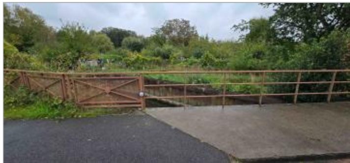
Repère sur la rambarde du pont rue de Fricambault à Pithiviers