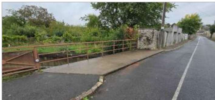
Pont rue de Fricambault à Pithiviers