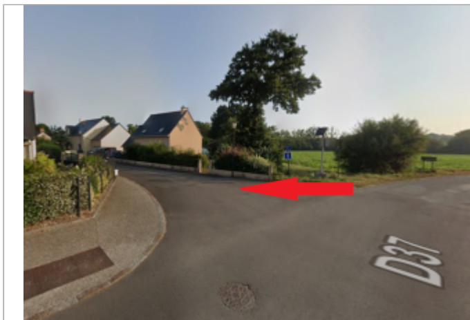
Début de l'allée des Cercliers