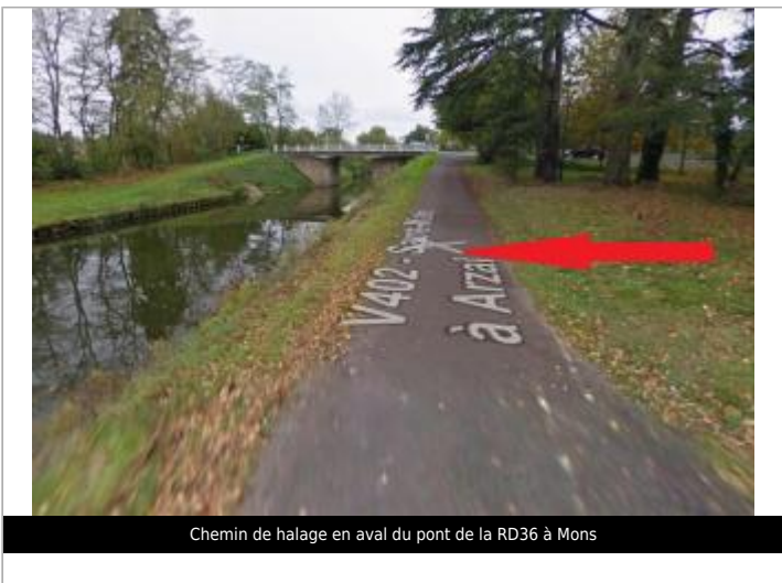
Chemin de halage en aval du pont de la RD36 à Mons

GÉOLOCALISATION Coordonnées WGS84 : X: -1.77286408 / Y: 48.02852980 Coordonnées RGF93 (Lambert 93) X: 344449.98 / Y: 6780542.84 Coordonnées RGF93 (ETRS89) : X: -1.7728641 / Y: 48.0285298 Code Hydro: J---0060 Rive de référence: Gauche