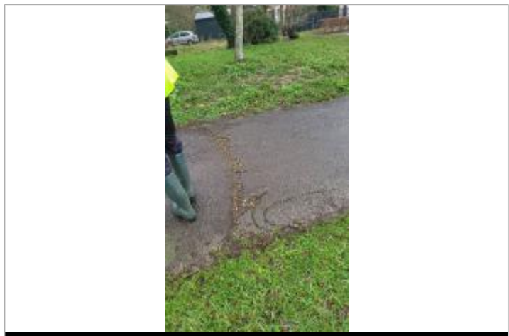
Relevé de la laisse d'inondation sur le chemin de halage

GÉNÉRAL Code : SPC_35047_028_2025 Date de mise à jour : 06/10/2025 Auteur : SPC VCB