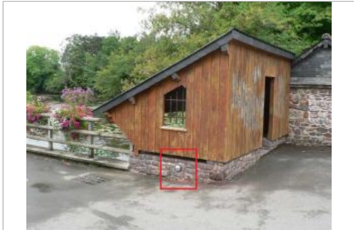
Lavoir, rue du 4 juin 1944