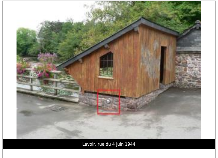
Lavoir, rue du 4 juin 1944