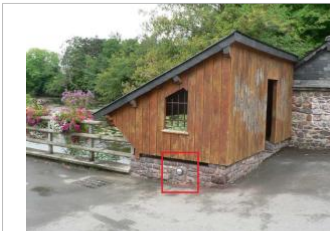
Lavoir, rue du 4 juin 1944

Coordonnées WGS84 : X: -1.95267363 / Y: 48.13532230