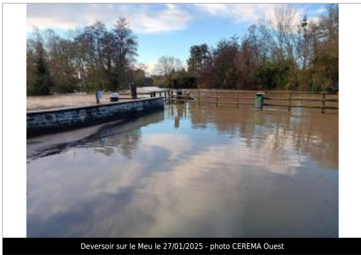
Deversoir sur le Meu le 27/01/2025

Maximum de l'inondation : Oui Visibilité : Oui État du repère : Bon Pérennité : Longue Repère calculé : Non PHEC : Non