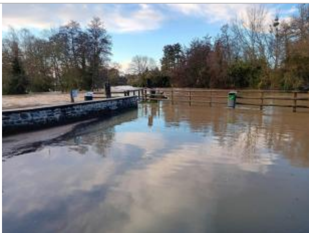
Deversoir sur le Meu le 27/01/2025