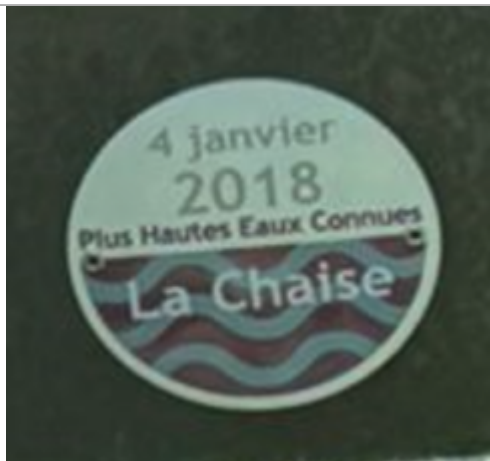
repère de crue au pont de la piste cyclable