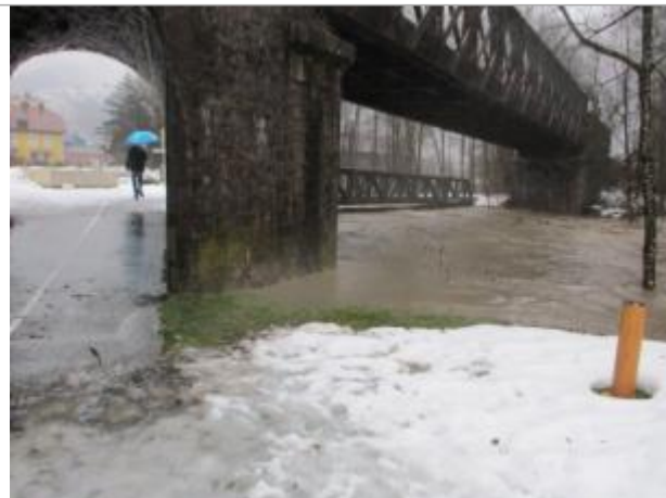
pont SNCF et pont la piste cyclable