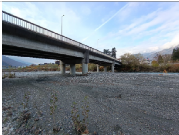
Pont du Mirantin