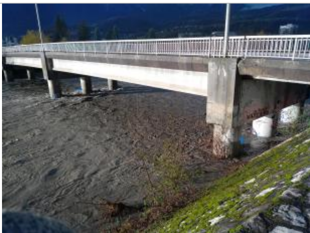
Photo prise le 13 décembre à 15h, vue de la rive gauche en aval du pont du Mirantin