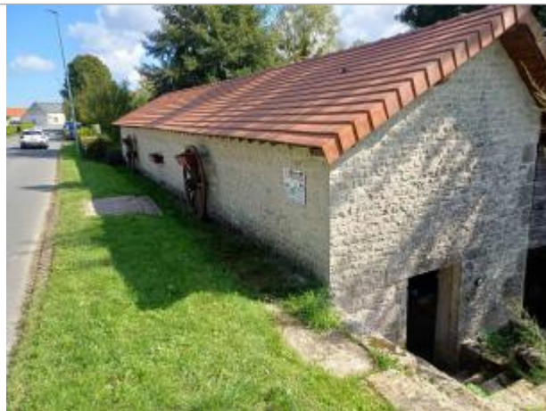
Lavoir de la rue Jules César à Nancray-sur-Rimarde