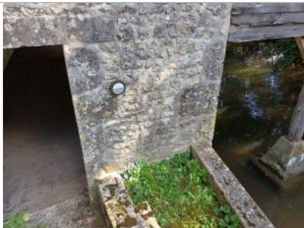
Repère du lavoir rue Jules César à Nancray-sur-Rimarde

Maximum de l'inondation : Oui Visibilité : Oui