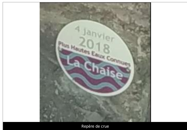
Repère de crue