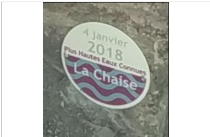
Repère de crue