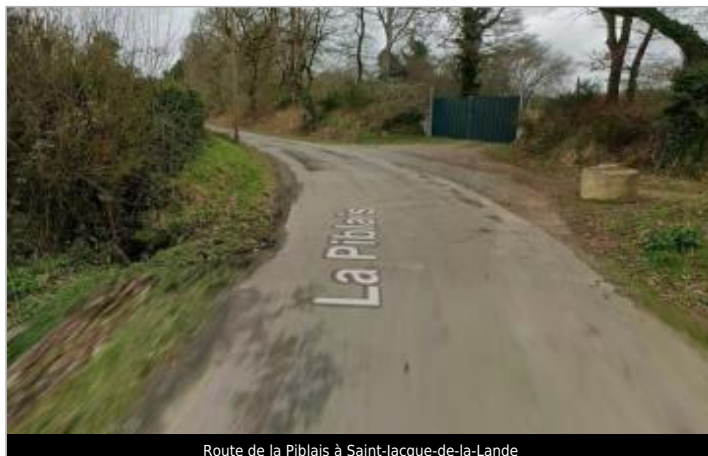
Route de la Piblais à Saint-Jacque-de-la-Lande

Coordonnées WGS84 : X: -1.74493836 / Y: 48.07851750