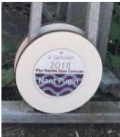
Repère de crue