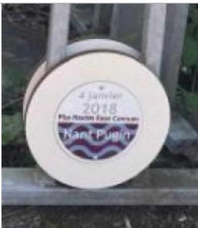
Repère de crue