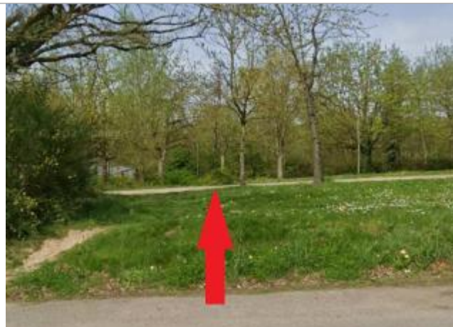
chemin d'accès au parking des étangs d'Apigné

Coordonnées WGS84 : X: -1.73999985 / Y: 48.09219470