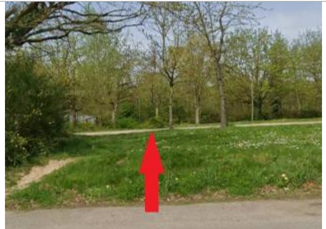
chemin d'accès au parking des étangs d'Apigné

Coordonnées WGS84 : X: -1.73990104 / Y: 48.09224580