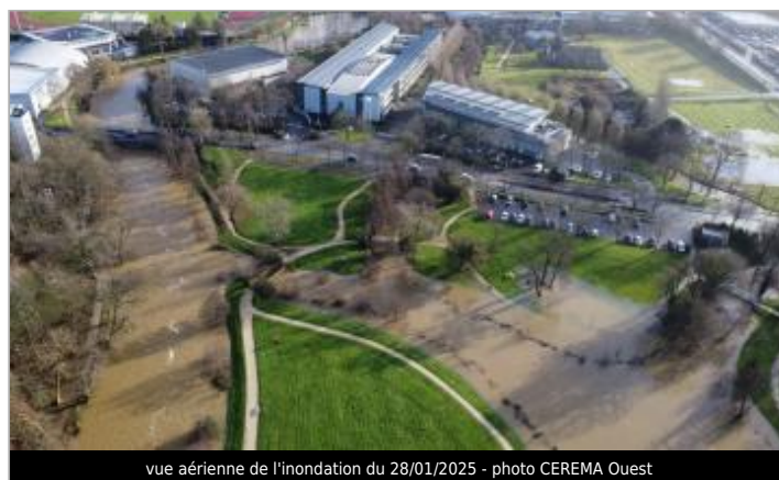
vue aérienne de l'inondation du 28/01/2025

GÉOLOCALISATION Coordonnées WGS84 : X: -1.60134275 / Y: 48.11638730 Coordonnées RGF93 (Lambert 93) X: 357781.18 / Y: 6789531.18 Coordonnées RGF93 (ETRS89) : X: -1.6013428 / Y: 48.1163873 Code Hydro: J---0060 Rive de référence: Gauche