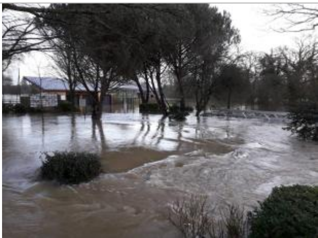
Practice et passerelle inondées