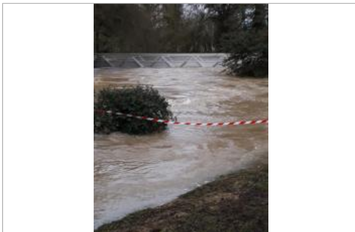
Passerelle du parc Dézerseul inondée le 28/01/2025

Coordonnées WGS84 : X: -1.58852896 / Y: 48.12647900