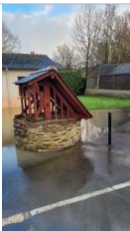
Puit sur le parking de la rue de l'ancien relais

Altitude calculée de l'eau (en m) : 33.744 m