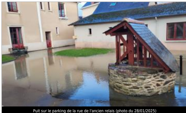
Puit sur le parking de la rue de l'ancien relais (photo du 28/01/2025)

Coordonnées WGS84 : X: -1.78966792 / Y: 48.14915530