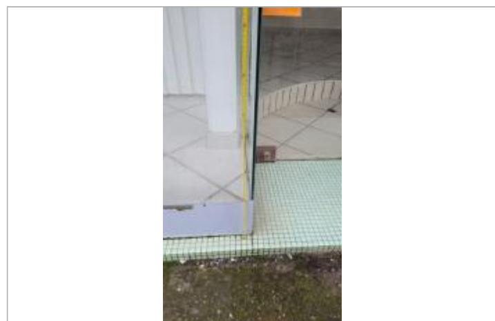
relevé de la laisse d'inondation sur le commerce

GÉNÉRAL Code : SPC_35210_11_2025 Date de mise à jour : 30/09/2025 Auteur : SPC VCB