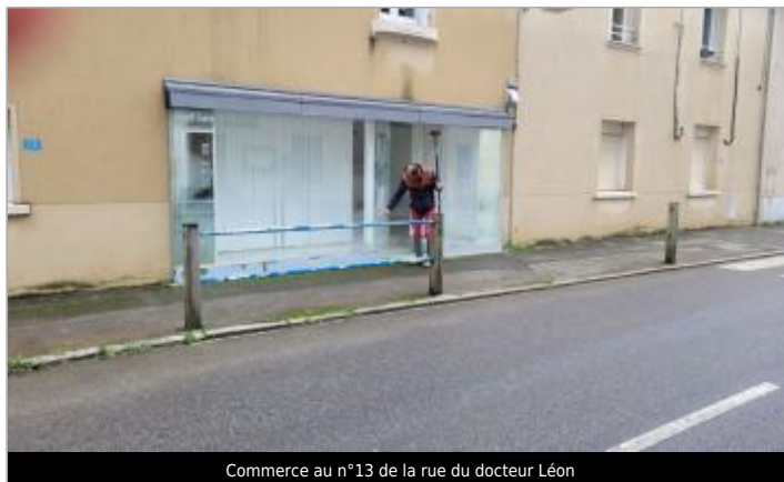
Commerce au n°13 de la rue du docteur Léon