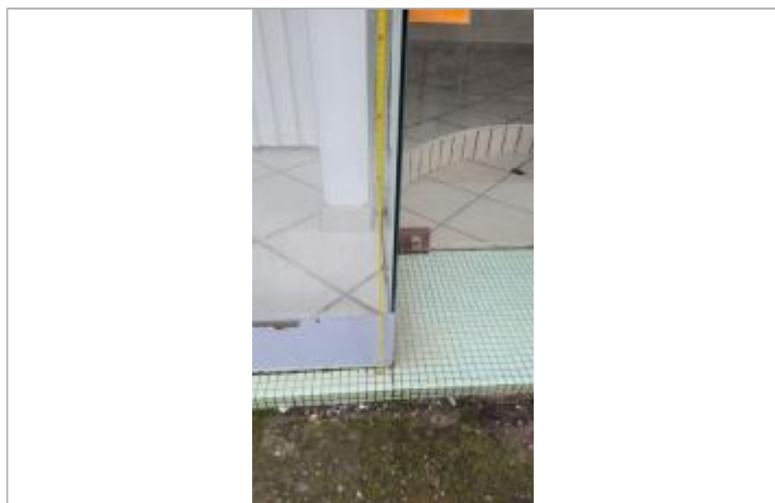
relevé de la laisse d'inondation sur le commerce

Altitude calculée de l'eau (en m) : 34.372