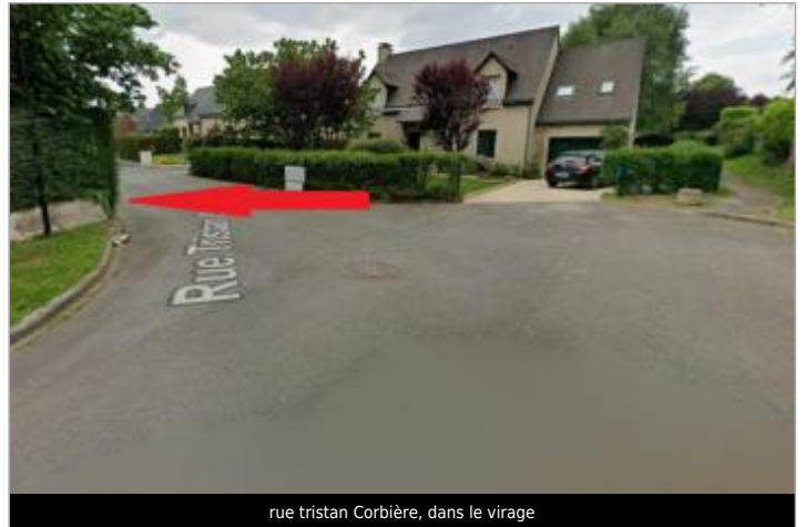
rue tristan Corbière, dans le virage

Coordonnées WGS84 : X: -1.79034474 / Y: 48.15028410