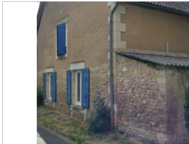
Vue sur la façade de l'habitation