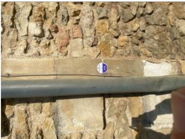
Vue sur la mur support du macaron

Altitude calculée de l'eau (en m) : 79.19